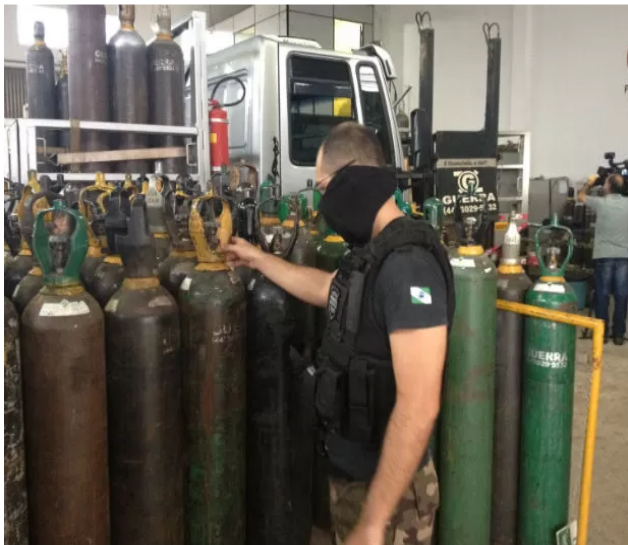
Segundo as investigações, cilindros industriais eram vendidos como se fossem medicinais

Ainda de acordo com o Gaeco, há cerca de outras dez empresas que estão sendo investigadas.