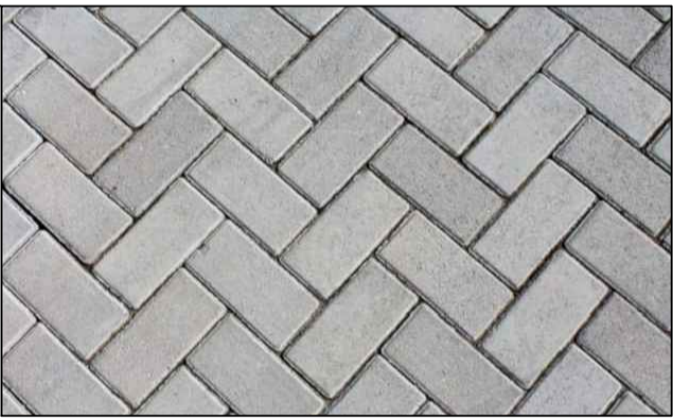
IMAGEM 1: REFERÊNCIA PAGINAÇÃO ESPINHA DE PEIXE NA COR CINZA