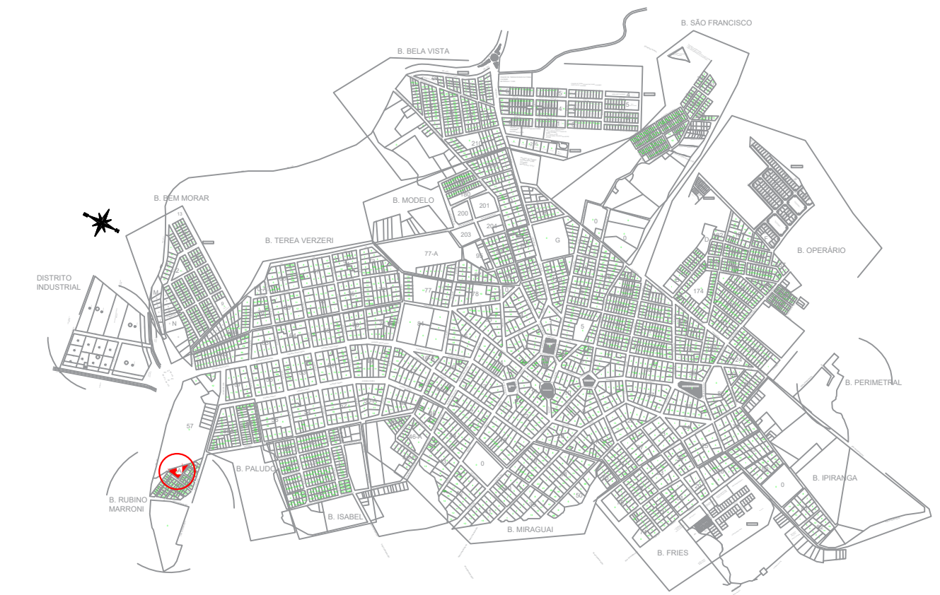
PLANTA DE SITUAÇÃO ESCALA 1:10000

DETALHE A —Tubo aço galvanizado Ø2 1/2" —Chapa de aço —2x parafusos com rosca soberba e cabeça sextavada + bucha fixado na alvenaria (c:70mm)